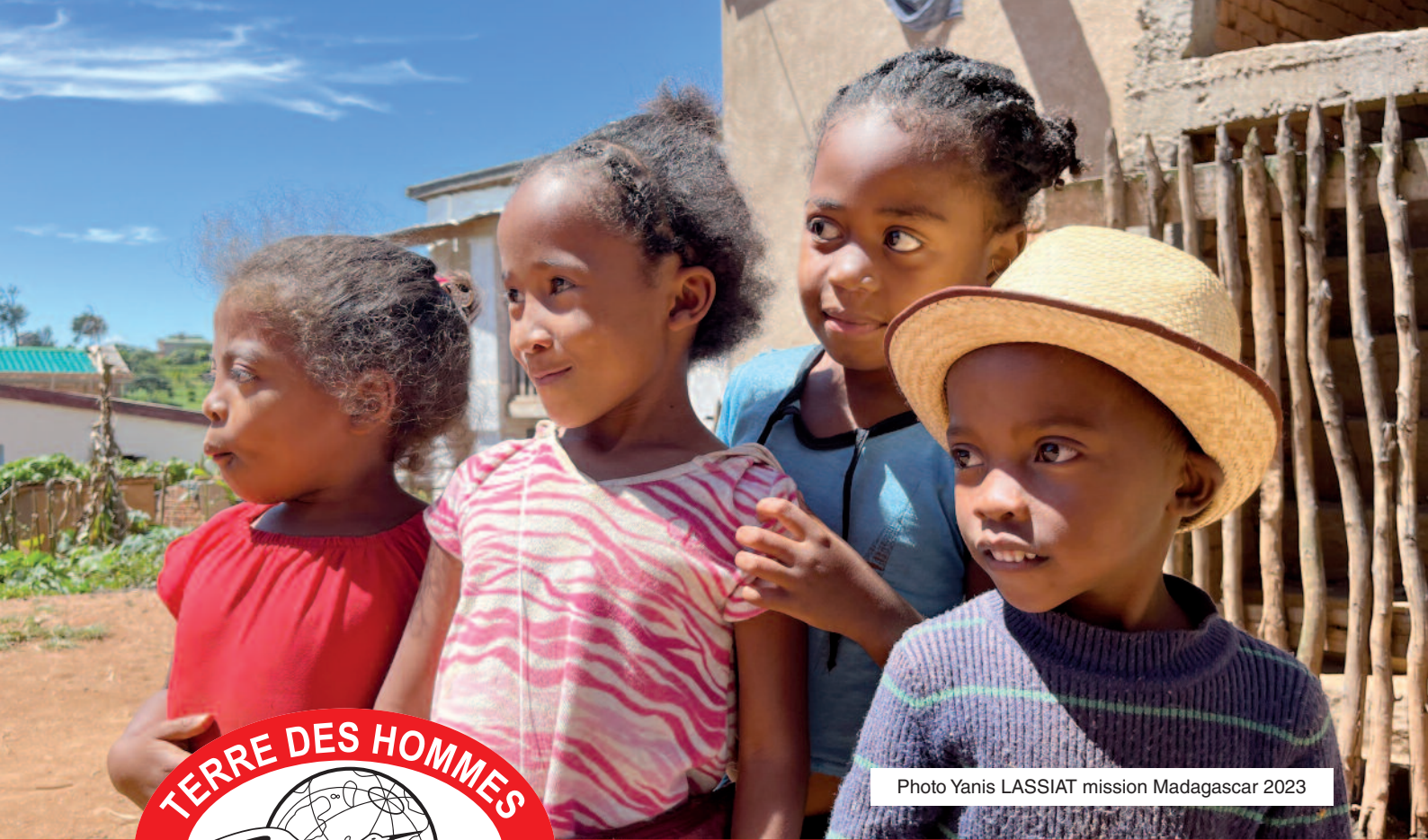
mission Madagascar 2023