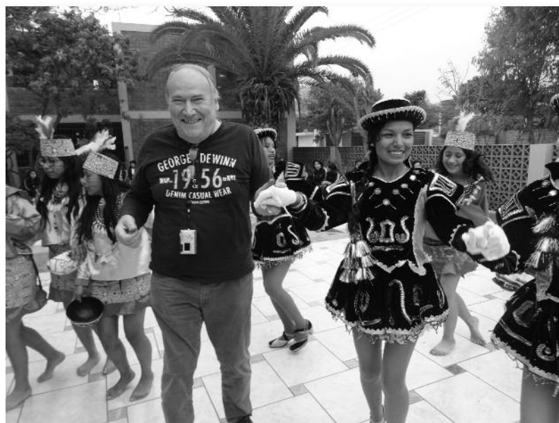
Avec les enfants de Puente Piedra à Lima