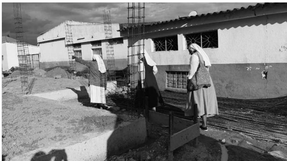
Photos du chantier supervisé par les soeurs.