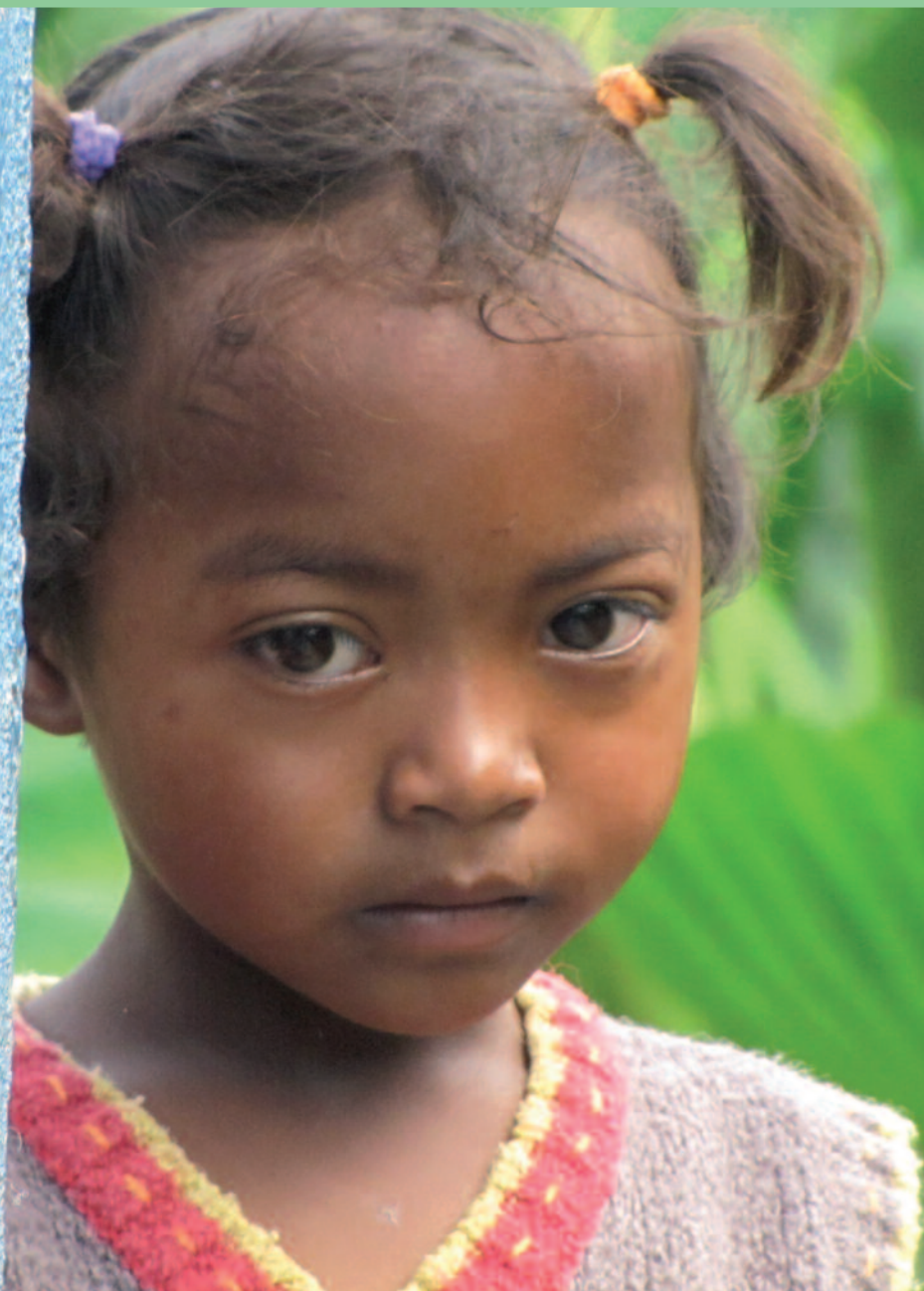
mission MADAGASCAR 2023