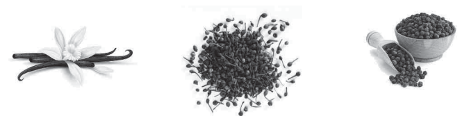
Vanille et poivre sauvage de Madagascar et Poivre du Brésil

Toujours un beau succès avec la vanille que nous présentons en tube. Cette année nous allons tenter aussi la poudre de vanille.